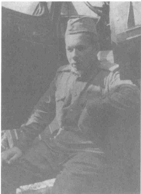
На сборах в Таманской дивизии. 1961 г.