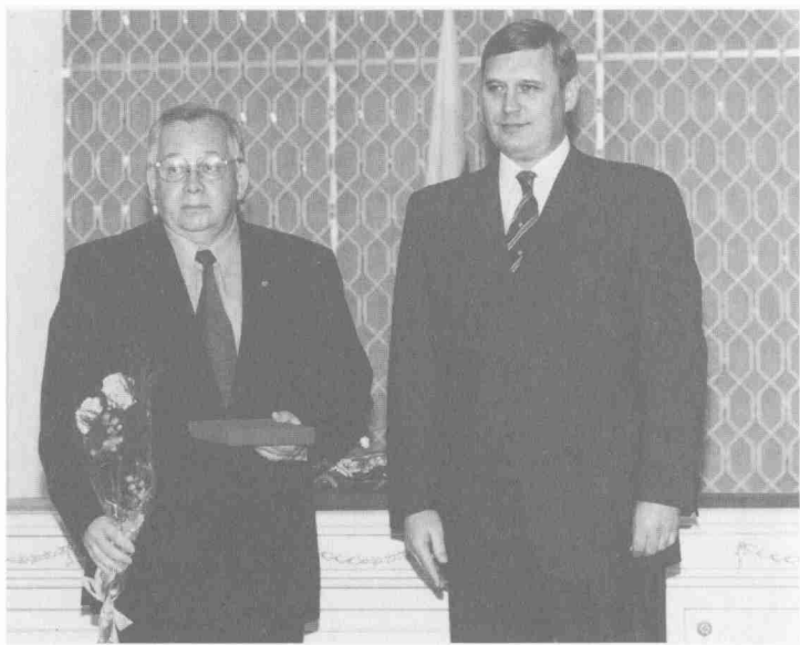
На вручении Государственной премии РФ в области науки и техники рядом с бывшим премьер-министром М.И. Касьяновым.