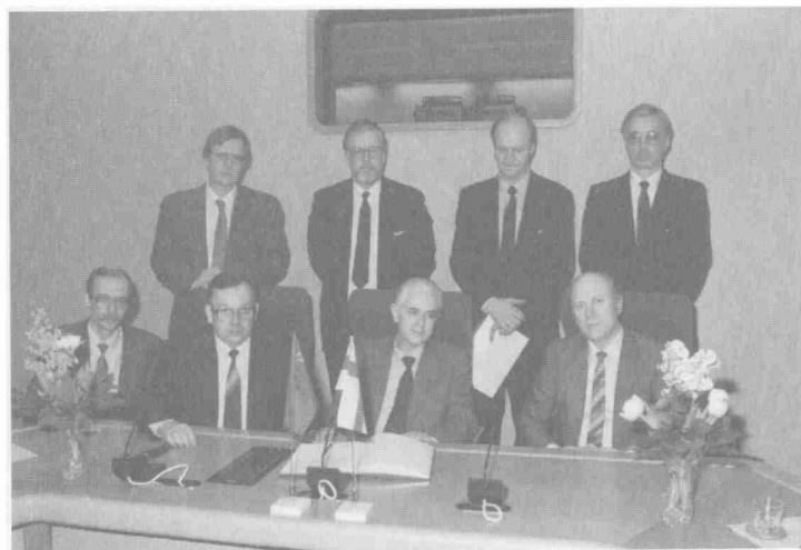
Подписание соглашения о проведении очередной встречи представителей породненных городов в г. Оулу (Финляндия). 1988 г.