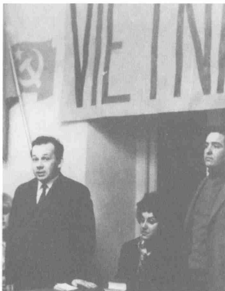
На молодежном митинге против войны во Вьетнаме. Италия, Рим. 1967 г.