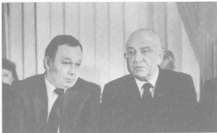
В президиуме Куйбышевской районной партийной конференции рядом с членом Политбюро ЦК КПСС, первым секретарем Московского горкома Коммунистической партии В.В. Гришиным. 1984 г.