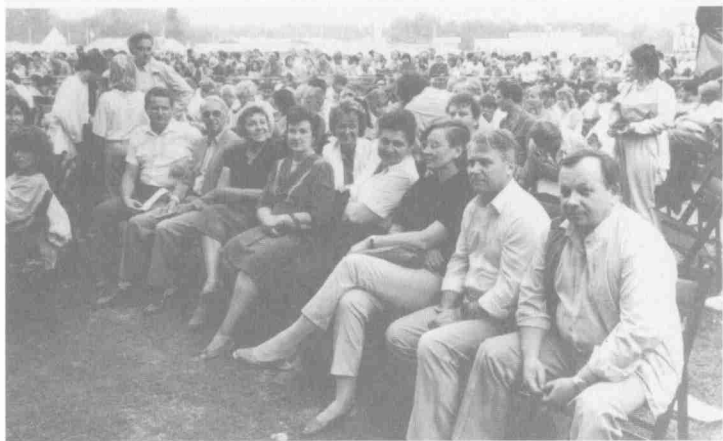
На митинге газеты французских коммунистов «Юманите» в Париже (Франция). 1989 г.