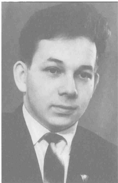
Студент Московского автомеханического института. 1960 г.