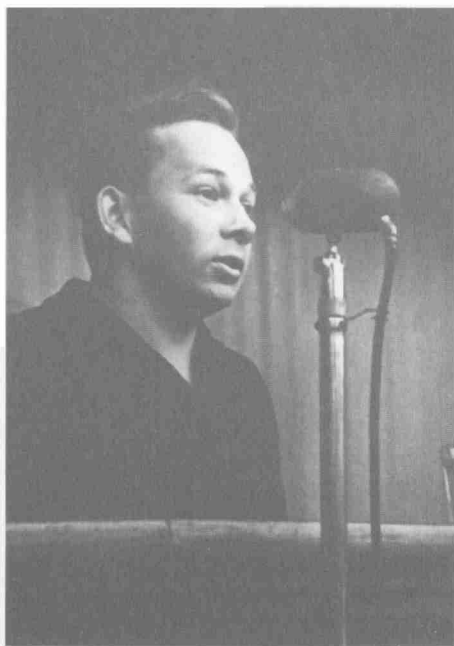
Секретарь Первомайского РК ВЛКСМ. Выступление на Дне молодежи в Измайловском парке. 1962 г.