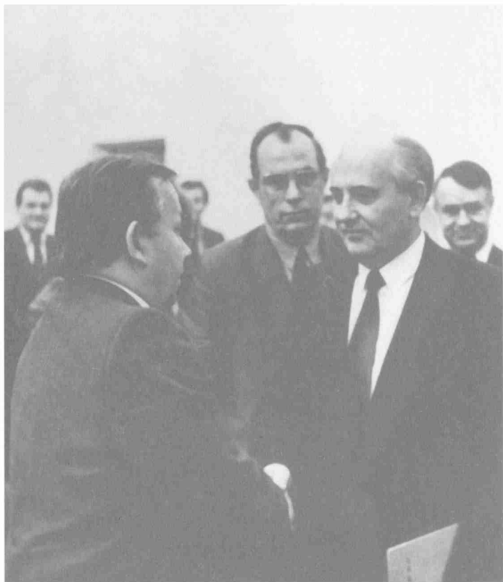
После избрания первым секретарем МГК КПСС Ю.А. Прокофьев получает поздравления от генерального секретаря ЦК КПСС М.С. Горбачева. На заднем плане: председатель исполкома Моссовета В.Т. Сайкин. 1989 г.