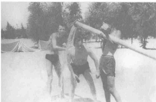
В молодежном строительном лагере в Египте. Долина Эль Натрум. 1965 г.