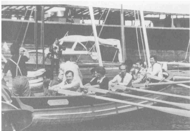
На встрече руководителей Ассоциации породненных городов мира в Сиэтле (США). 1987 г.