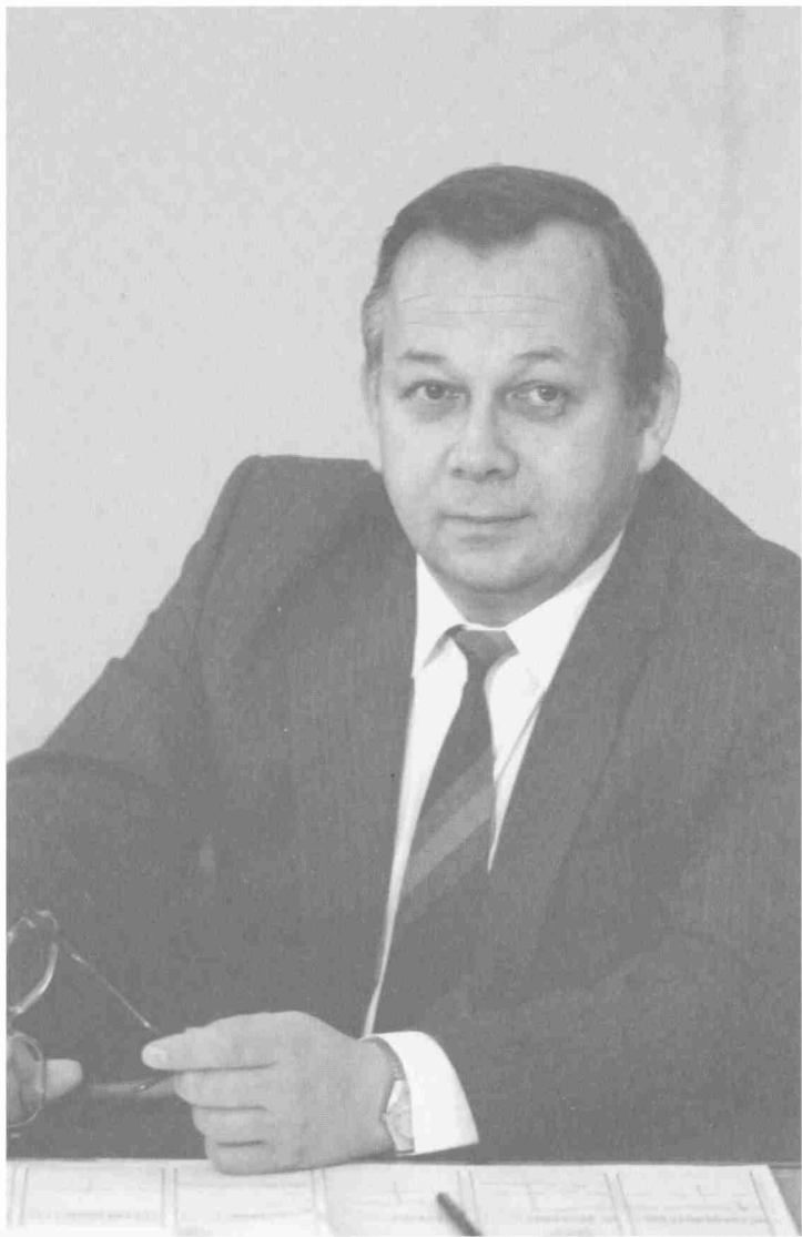
Первый секретарь МГК КПСС в собственном кабинете. 1990 г.