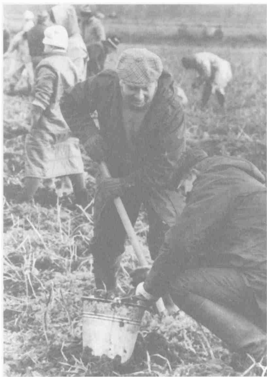
На уборке картофеля в совхозе «Раменский» (Московская обл.) вместе с аппаратом МГК КПСС. Осень 1990 г.