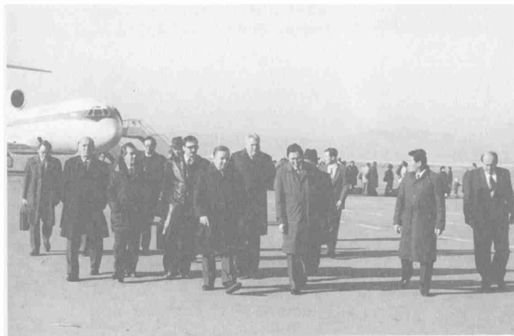
Встреча в аэропорту г. Улан-Батора (Монголия). 1990 г.