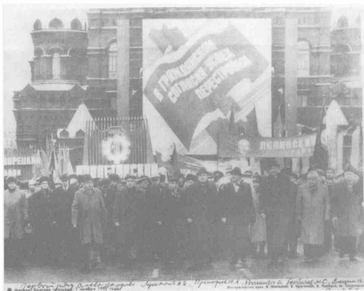
Последняя ноябрьская демонстрация. В первом ряду последний раз идущие вместе под красными знаменами (слева направо): Лукьянов А.И., Прокофьев Ю.А., Рыжков Н.А., Горбачев М.С., Ельцин Б.Н., Попов Г.Х. Москва, Красная площадь. 7 ноября 1990 г.