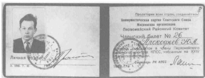
Членский билет кандидата в члены Первомайского РК КПСС. 1963 г.