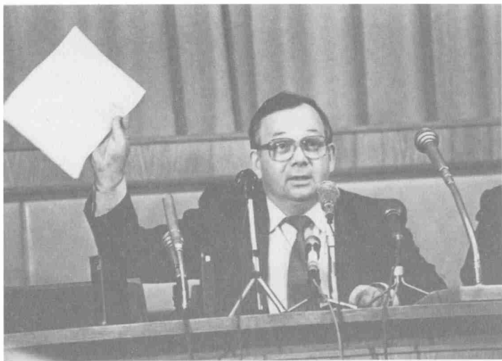
На пресс-конференции в МГК КПСС. 1990 г.