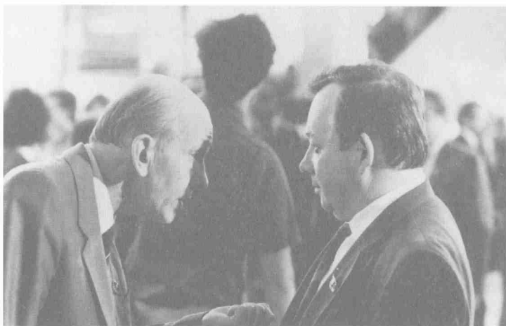
На XXVIII съезде КПСС. Дискуссия с академиком С.С. Шаталиным.