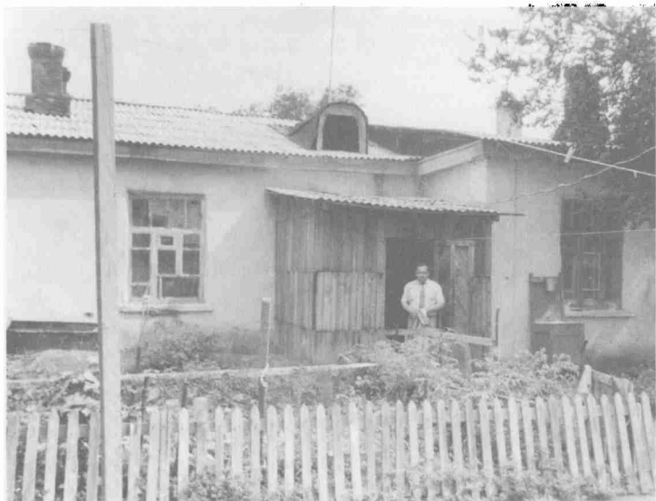
На пороге родного дома в г. Муйнаке Каракалпакской АССР, где родился в 1939 г. 1990 г.