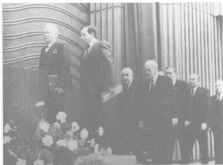
Перед собранием, посвященным встрече избирателей Куйбышевского района г. Москвы с кандидатом в депутаты Верховного Совета СССР генеральным секретарем ЦК КПСС К.У. Черненко. Второй снизу – будущий разрушитель КПСС и СССР М.С. Горбачев. Дворец съездов. 1984 г.